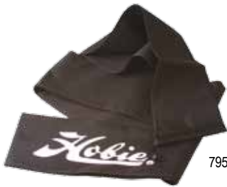
79510202 SAC DE VOILE